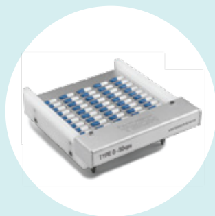
ΓΕΜΙΣΤΗΣ 90 ΚΑΨΟΥΛΩΝ